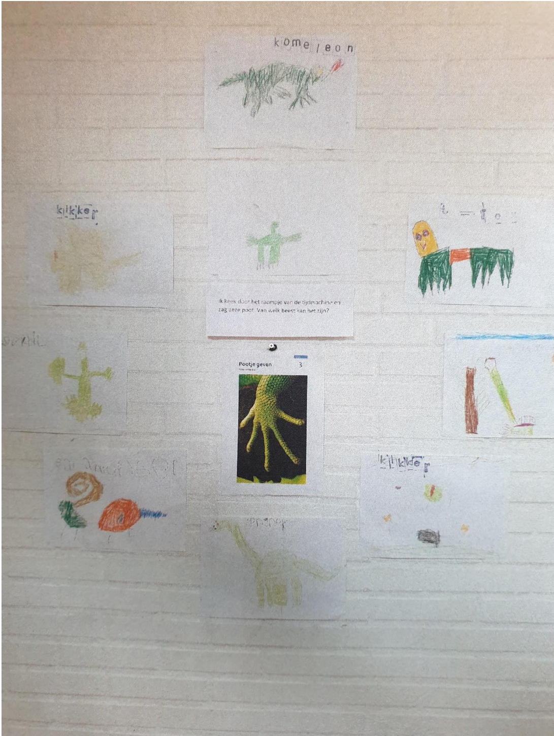
Filosoferen met jonge kinderen Chantal Razoux Kühr JPS de Wilgenhoek in Leerdam Opleidingsgroep midden