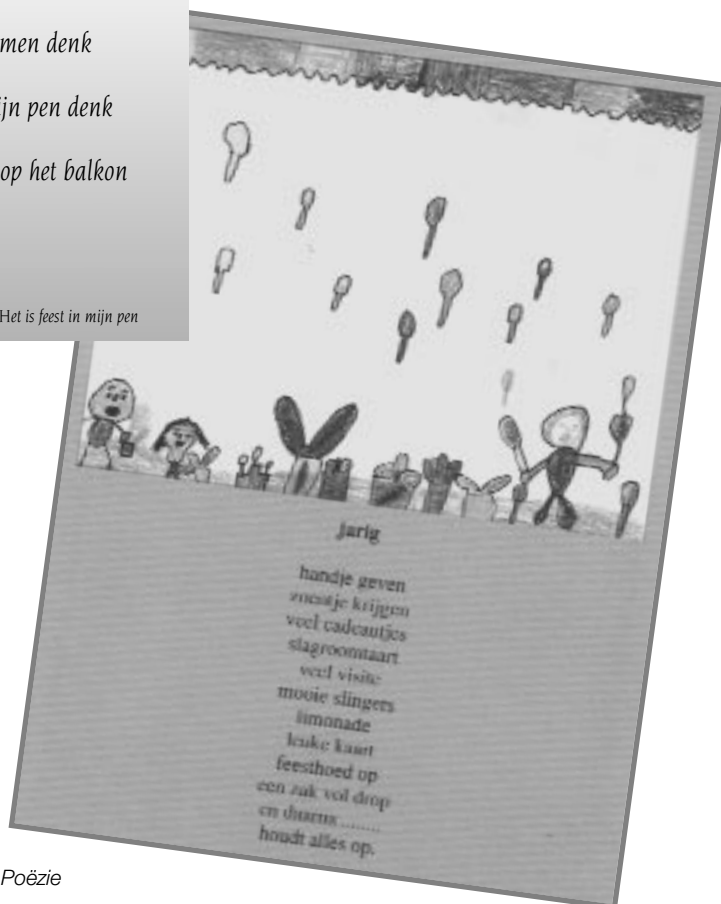
Stichting Kinderen en Poëzie Uit: Het is feest in mijn pen tekst: OBS Den Andel

Tot slot: misschien overbodig: Afspraken over vorm kunnen richting geven aan gewenste doelen. Maar de afspraak kan ook een knellend harnas worden, waardoor je niet meer kunt zeggen wat je wilt. Leer de kinderen dat ze afspraken ook kunnen doorbreken. Lees nogmaals 'De Waterlelie'. ■